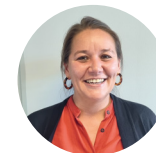
Sarah Recyclage et réglementaire